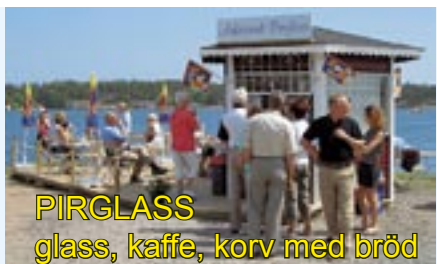
PIRGLASS glass, kaffe, korv med bröd